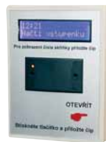
Terminál pro kontrolu stavu konta elektronické peněženky.

vratná záloha proti ztrátě čipu. V ten okamžik se z čipových hodinek stává „elektronická peněženka“. Návštěvník tak může v rámci vnitřního areálu využít nabídky občerstvení bistra