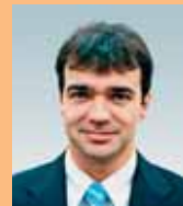
Vážený občané města Olomouce,